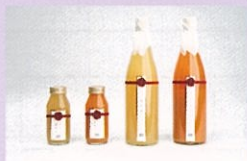
長野県営業局 「Session信州」 紡ぎ「あかあかと」「いろふかし」

各地方自治体や金融機関での商品開発サポート実績、合計約20地域、全国の中小事業者との情報連携700社以上、セミナー実績年間約50件以上。