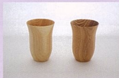
関東経済産業局 KANTO 11 星野工業株式会社 "THOOK"