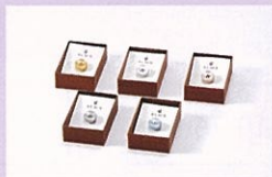
東京都墨田区 墨田地域ブランド戦略 株式会社石井精工 "ALMA"